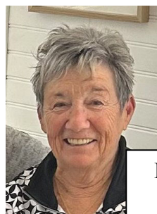
PRATO Suzanne Logistique