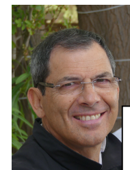
MICHEL Alain Reportages Vidéo