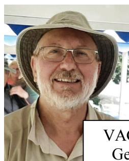
VAGUE Georges Gestion du site Vélo jeudi Inscriptions